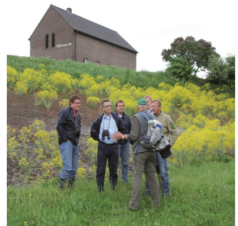
Burgerinitiatief Lingewaard Natuurlijk

Stichting Marke Mallem en het waterschap Rijn en IJssel organiseren samen met Alterra een bijeenkomst over hun experiment van zelfbestuur waarbij bewoners van Eibergen zelf natuur en landschap langs de Berkel inrichten en beheren. In deze bijeenkomst voor waterschappen, gemeenten en provincies gaan we in op succes- en faalfactoren, leerpunten en aanbevelingen voor de toekomst. Marke Mallem heet ons welkom in het Muldershuis in Eibergen.