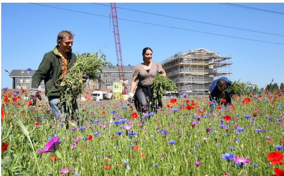
Burgerinitiatief De Heimanshof in Haarlemmermeer

“Hoe zorg je dat het werken met burgerinitiatieven echt een organisatie-issue wordt en niet alleen afhankelijk is van één persoon?”