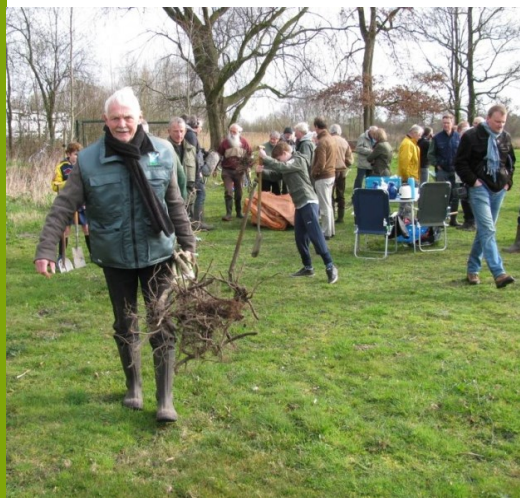
De Dommelbimd in Boxtel

Drie inwoners van Boxtel hebben in april 2013 het initiatief genomen om het prachtige Dommeldal gebied van 6,5 ha aan te kopen om deze daarmee als natuurgebied te behouden voor de burgers van Boxtel. Het Brabants Landschap financierde de aankoop voor. De drie bewoners hebben zich verenigd in de Stichting Dommelbimd en hebben tot 1 januari 2015 de tijd om het geld bij elkaar te verzamelen om daarmee het eigendom over te nemen. De Stichting wil door de verkoop van certificaten van duizend euro, aangevuld met bijdragen van onder meer Het Groene Woud en de provincie, de aankoop financieren. De Stichting betreft de burgers van Boxtel en nabijgelegen scholen intensief bij de verwerving en bij de toekomstige inrichting en beheer van het gebied. Naast behoud van het gebied is een belangrijk nevensdoel de vergroting van de belevingswaarde.